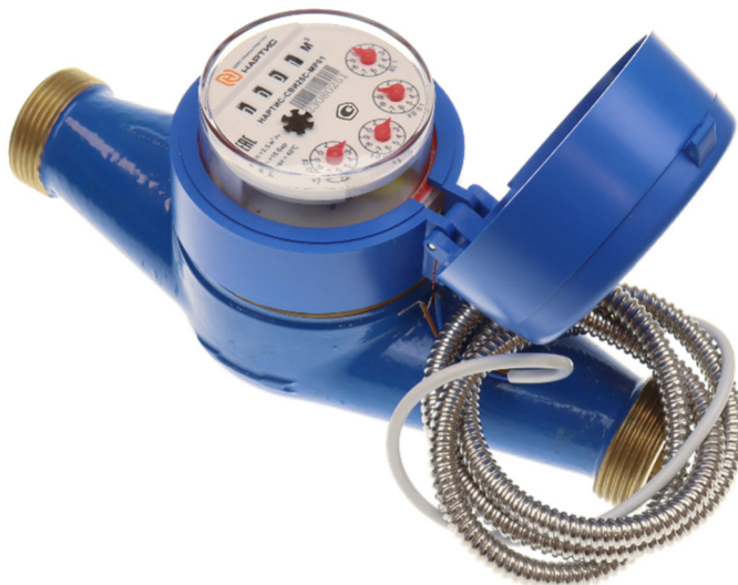
Рисунок 1 – Внешний вид счетчика НАРТИС-СВИ

2.4.1 Счетчик состоит из корпуса с резьбовым присоединением (проточной части), крыльчатки и счетного устройства с индикатором, соединенных между собой пластмассовой крышкой. Общий вид счетчика представлен на рисунке 1.